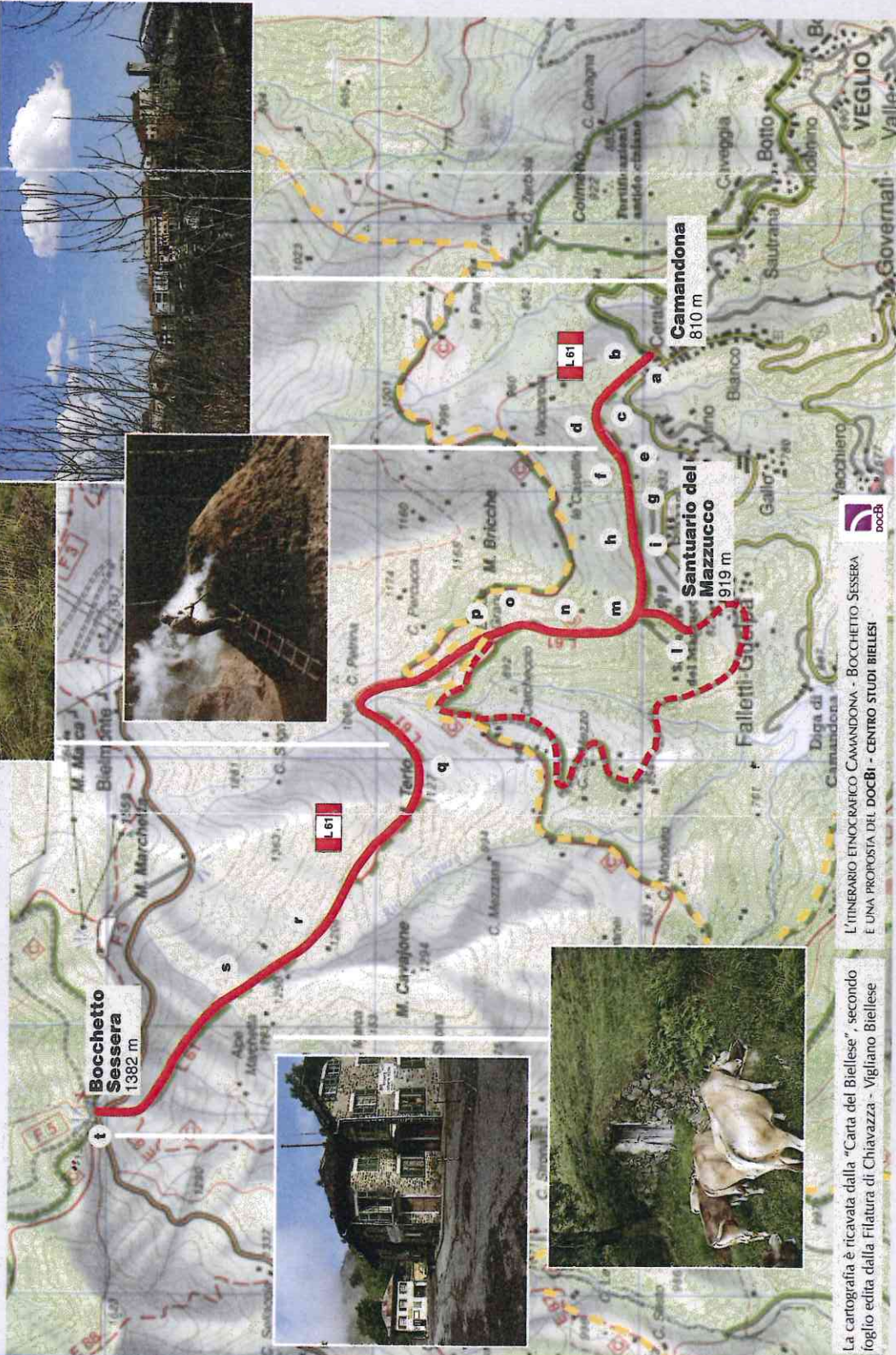
La cartografia è ricavata dalla "Carta del Biellese", secondo foglio edita dalla Filatura di Chiavazza - Vigliano Biellese