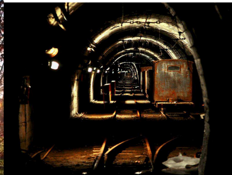
Miniere di Cogne

PER TUTTI I DETTAGLI E GLI AGGIORNAMENTI CONSULTATE IL SITO: WWW.LOVEVDA.IT