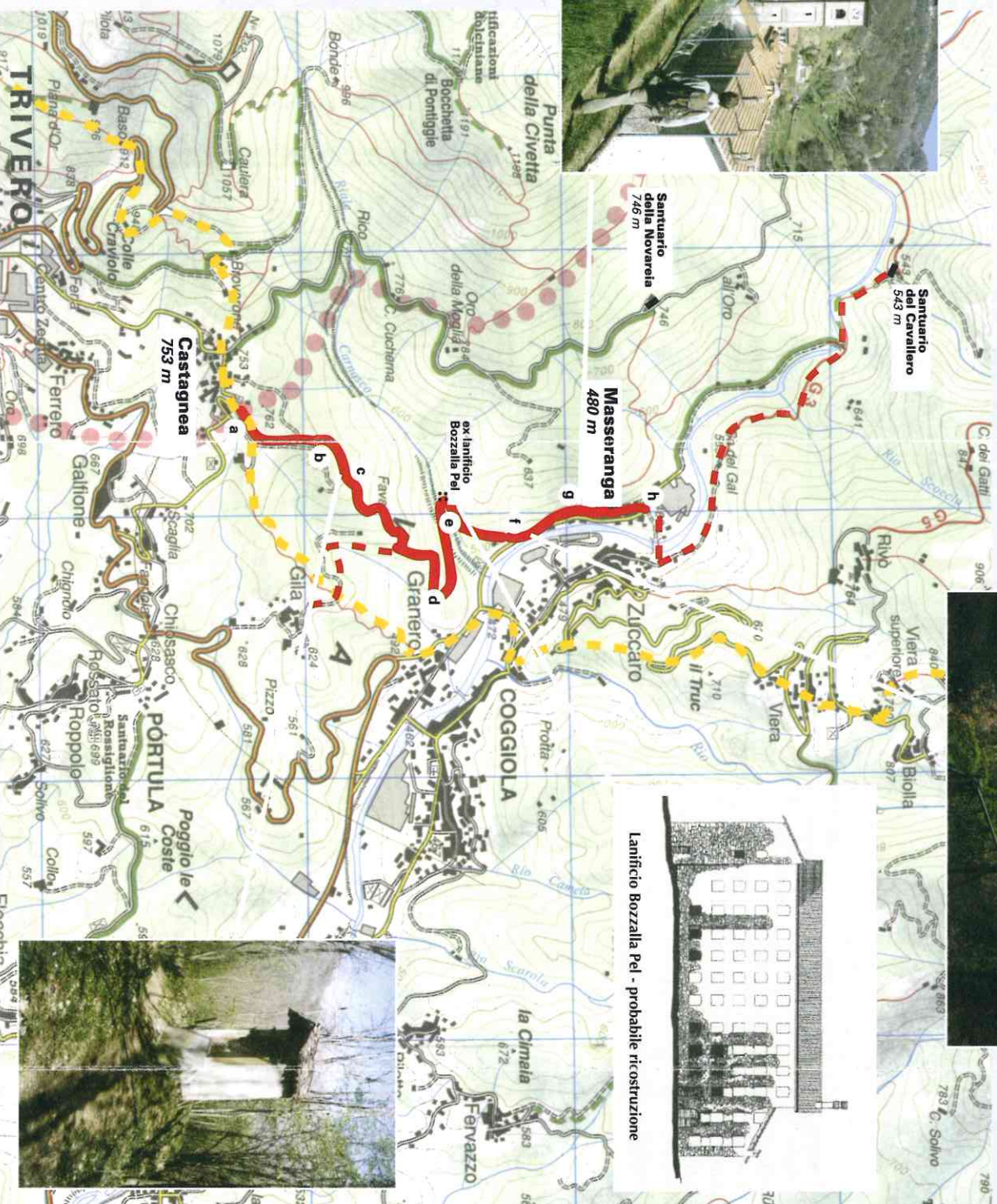
Lanificio Bozzalla Pel - probabile ricostruzione